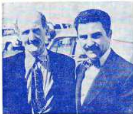
Archange et un frère guéri d'un cancer lors d'une de ses missions.