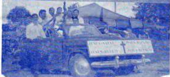
En haut : le groupe devant la tente. En bas : départ des musiciens et chanteurs pour la propagande en ville sous la direction du prédicateur Pagon debout à la portière.