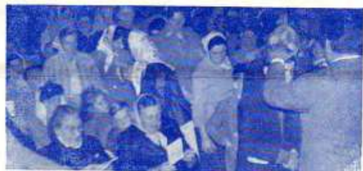
Raphaël imposant les mains aux malades

« Le Seigneur a abondamment béni le passage de notre frère RAPHAEL dans la ville de Menin. Le dernier jour de la campagne sous la tente, un jeune homme est venu me trouver, disant qu'il avait écouté à l'extérieur la Parole qui fut précieuse. Il voulait la paix dans son cœur. Il me dit qu'il voulait