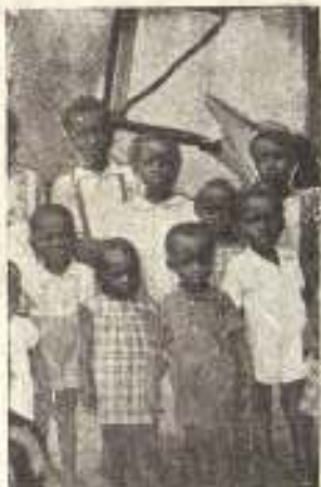
PETITS ENFANTS DU GABON (Afrique Équatoriale Française)

Écrivez en quelques lignes ce que vous pouvez faire pour permettre aux autres de connaître l'amour de Jésus.