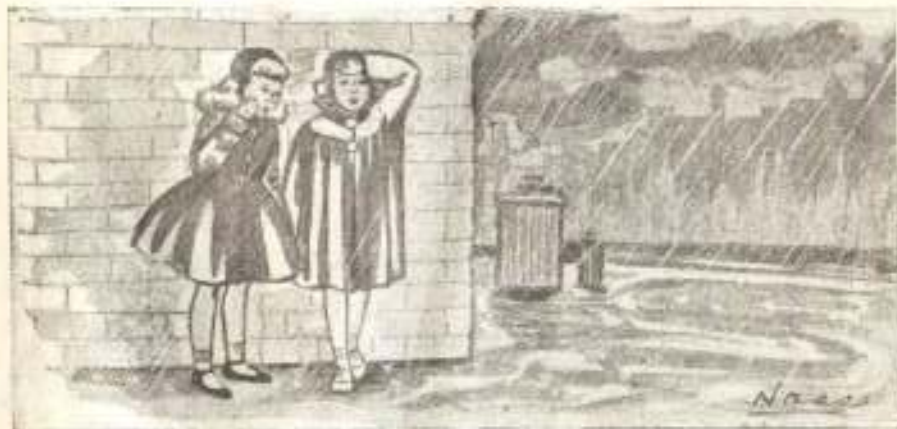
Se confiant dans le Seigneur, ces fillettes n'ont point peur de la violence de l'orage.

Paul avait eu raison. Dieu ne l'avait point abandonné et alors que tous les autres étaient dans l'inquiétude, lui était calme et paisible parce que toute sa confiance était placée en Dieu qui avait la puissance de le garder.