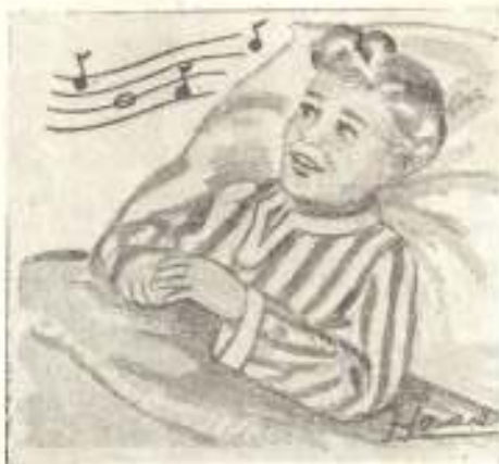
Chantez les louanges du Seigneur même dans la souffrance.

Vous avez trouvé ce qu'ils faisaient ? C'est bien de le savoir, mais lorsque vous serez dans la difficulté, l'épreuve, la maladie, faites comme eux et le Seigneur vous bénira.