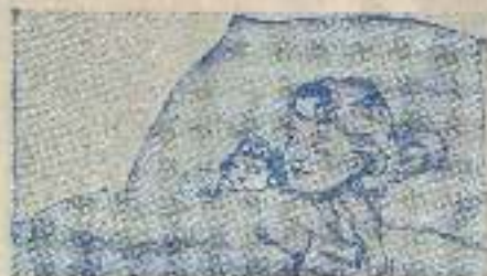
Même pendant ton sommeil le Seigneur veille sur toi.

Il y avait guerre entre la Syrie et Israël. Comme c'est terrible la guerre ! Mais Dieu révéla à Elisée plusieurs fois à quel endroit le camp des Syriens se trouverait. Aussi le roi de Syrie était-il furieux de voir que ses secrets étaient connus sans qu'il les dévoilât