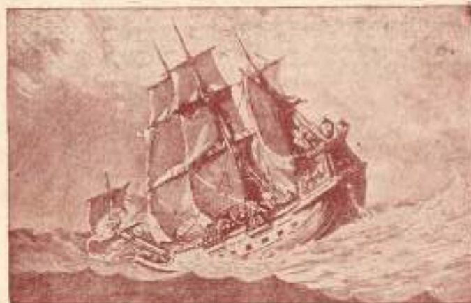
Un malheureux mariage est semblable à un usfrage

Il faut en con- clure, bien que cela nous semble dur, que de telles expériences peu- vent être consi- dérées comme des punitions pour les fautes posées. On ré- colte ce que l'on a semé. Qui sème le vent ré- colte la tempête. « Celui qui sème pour sa chair, moissonnera la corruption de la chair » (Épître aux Galates VI : 9). C'est la loi de Dieu.