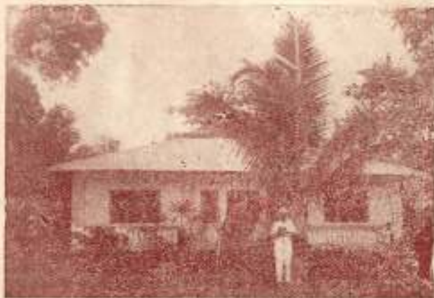
Maison Coloniale de LIBREVILLE (Gabon)

Par missionnaire africain, j'entends le missionnaire européen envoyé en Afrique. Il ne doit être ni un intellectuel, ni un artisan, dans ce que ces deux états ont d'opposé l'un à l'autre. Si le Missionnaire n'est qu'un intellectuel, un théologien au sens qu'on donne habituellement à ce mot, il n'aura autour de lui que des vaniteux et des orgueilleux qui n'apprécieront qu'à être au-dessus de leurs semblables en méprisant tous travaux manuels. Si