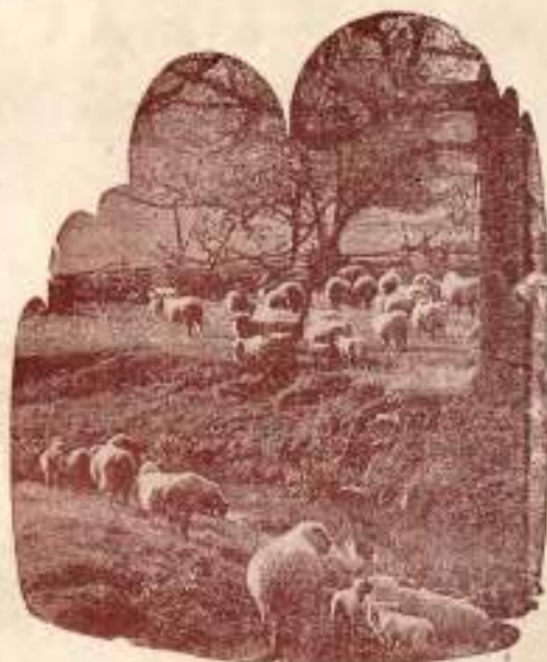
Le Bon Berger « sacrifie » sa vie pour ses brebis. Jean 10:11

Hier soir comme je rentrais chez moi, revenant de la réunion de Londres, j'ai remarqué les réverbères le long de la route. Semaine après semaine, ils sont là, continuant de briller montrant aux hommes, dans l'obscurité